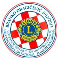
D 126 Hrvatska